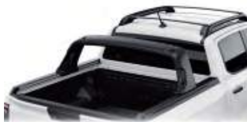
FLEXIBLE RACK SYSTEM - FUNKcjONALNY SYSTEM MOCOWANIA ŁADUNKU 11 300 zł dla wersji Limited 10 380 zł dla wersji: Wildtrak i Wildtrak X