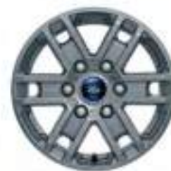
16" OBRĘCZE KÓŁ ZE STOPÓW LEKKICH Standard dla wersji XLT