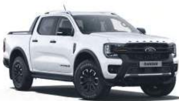
FROZEN WHITE - LAKIER ZWYKŁY bez dopłaty