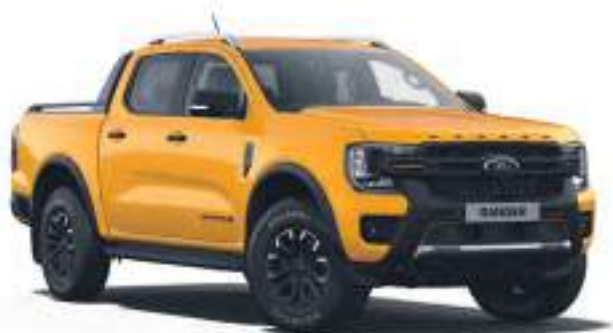
CYBER ORANGE - LAKIER SPECJALNY 3 700 zł | lakier dostępny tylko dla wersji Wildtrak i Wildtrak X