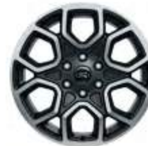
20" OBRĘCZE KÓŁ ZE STOPÓW LEKKICH Opcja dla wersji Wildtrak