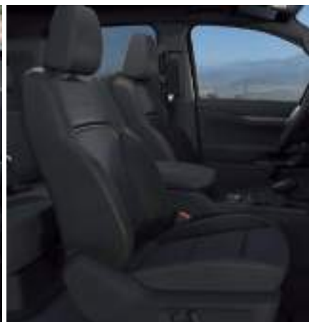
FORD RANGER W WERSJI WILDTRAK X Z LAKIEREM ZWYKŁYM FROZEN WHITE (BEZ DOPLATY)