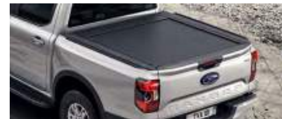
ALUMINIOWA ROLETA SKRZYNI ŁADUNKOWEJ 7 650 zł dla wszystkich wersji z wyjątkiem XL