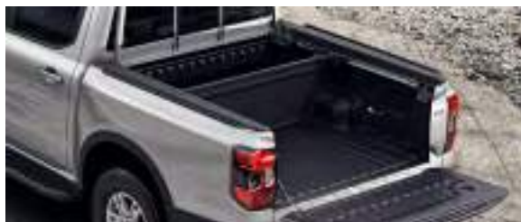
RUCHOMA PRZEGRODA SKRZYNI ŁADUNKOWEJ 2 500 zł dla wersji XL, XLT, Tremor 1 750 zł dla pozostałych wersji