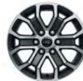
18" OBRĘCZE KÓŁ ZE STOPÓW LEKKICH Opcja dla wersji Limited Standard dla wersji Wildtrak