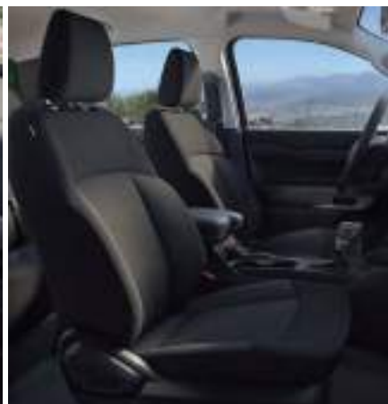
FORD RANGER W WERSJI XLT Z LAKIEREM METALIZOWANY BLUE LIGHTING (OPCJA)