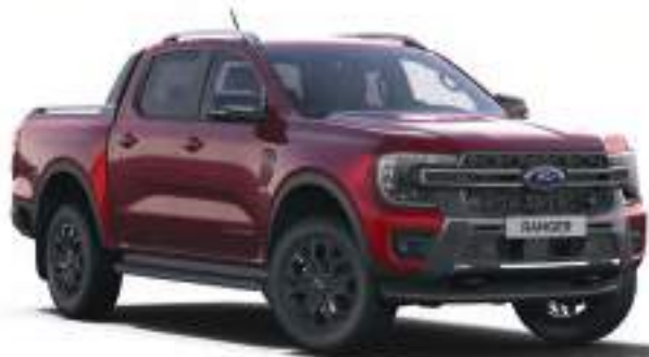
LUCID RED - LAKIER SPECJALNY 3 700 zł | lakier niedostępny dla wersji Wildtrak X