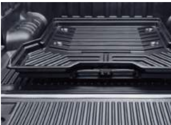
PICKUP ATTITUDE - PRZESUWNA PLATFORMA BAGAŻOWA 5 140 zł