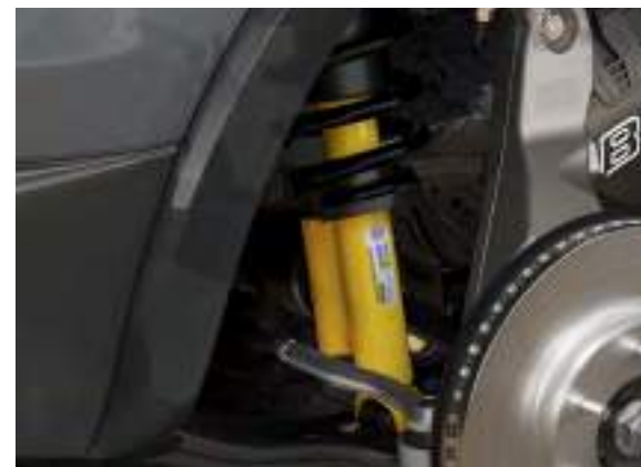
ZAWIESZENIE BILSTEIN - TERENOWE Standard dla wersji Tremor i Wildtrak X