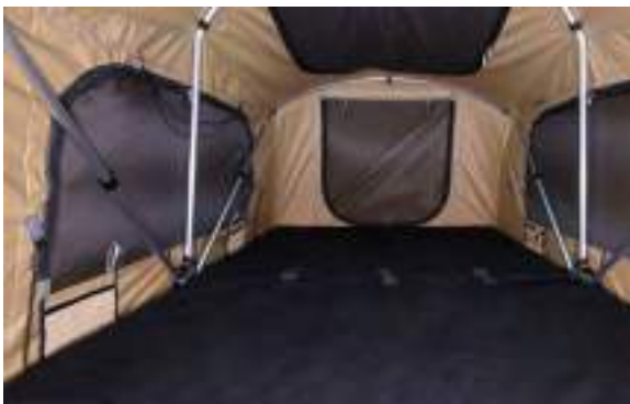
NAMIOT DACHOWY FLINDERS - Z DRABINKĄ 6 990 zł