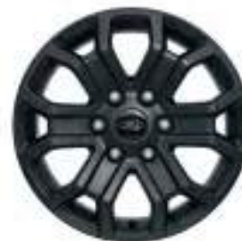
18" OBRĘCZE KÓŁ ZE STOPÓW LEKKICH Opcja dla wersji Wildtrak