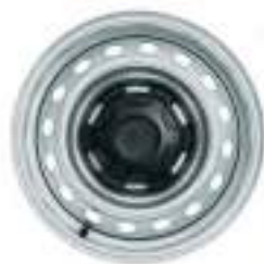
16" STALOWE OBRĘCZE KÓŁ Standard dla wersji XL