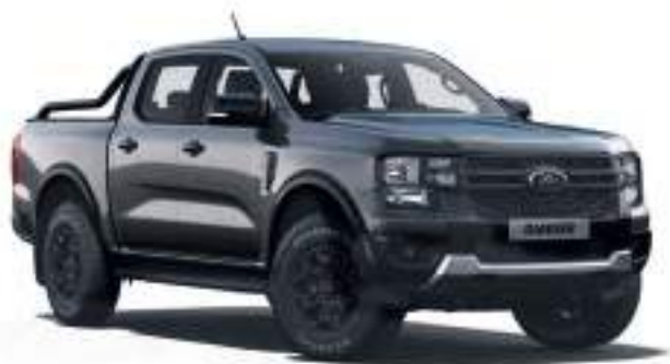
CONQUER GREY - LAKIER PERFORMANCE 3 200 zł | lakier dostępny tylko dla wersji Tremor