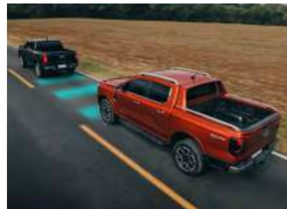
INTELENTNY TEMPOMAT ADAPTACYJNY - działający w oparciu o system rozpoznawania znaków drogowych, z systemem Stop&Go oraz Line Centring Standard dla wersji Platinum. Dla pozostałych wersji - Pakiety Technology