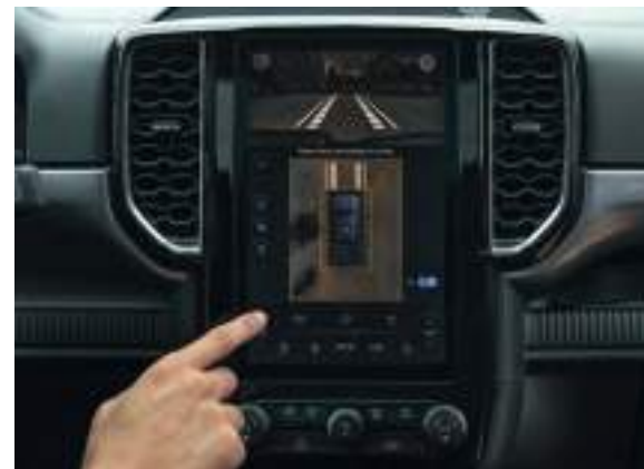
SYSTEM KAMER 360 STOPNI Standard dla wersji Platinum. Dla wersji Limited, Wildtrak i Wildtrak X Opcja dostępna tylko w pakietach Technology