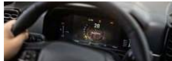
KOLOROWY, KONFIGUROWALNY WYŚWIETLACZ NA TABLICY ZEGARÓW 12.4" - standard dla wersji Platinum (górna grafika) 8" - standard dla pozostałych wersji (dolna grafika)