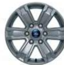
17" OBRĘCZE KÓŁ ZE STOPÓW LEKKICH Dla wersji XLT opcja dostępna w Pakiecie Technology 50