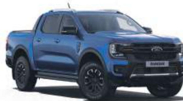
BLUE LIGHTING - LAKIER METALIZOWANY 3 200 zł | lakier niedostępny dla wersji XL i Platinum