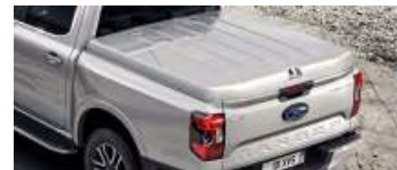
TWARDA POKRYWA SKRZYNI ŁADUNKOWEJ - 1. CZĘŚCIOWA 7 400 zł dla wersji Limited