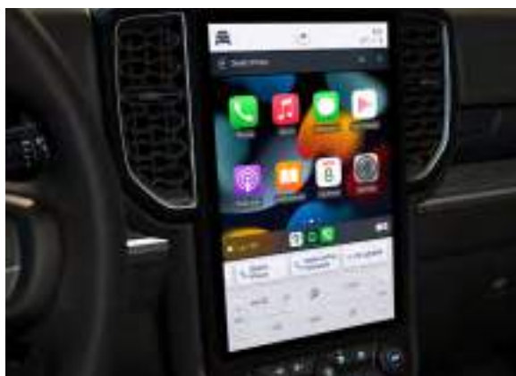
SYSTEM MULTIMEDIALNY FORD SYNC 4A Z BEZPRZEWODOWĄ OBSŁUGĄ APPLE CARPLAY I ANDROID AUTO Standard