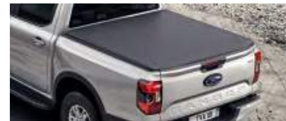
MIĘKKA ROLETA SKRZYNI ŁADUNKOWEJ 2 700 zł dla wersji XL, XLT, Tremor, Limited