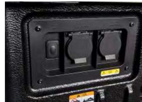
PRZETWORNICA NAPIĘCIA Z GNIAZDAMI 230V

Standard dla wersji Platinum Dla pozostałych wersji opcja dostępna tylko w Pakietach marketingowych