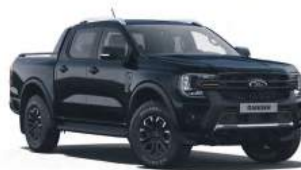
AGATE BLACK - LAKIER METALIZOWANY 3 200 zł