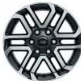
18" OBRĘCZE KÓŁ ZE STOPÓW LEKKICH Standard dla wersji Limited