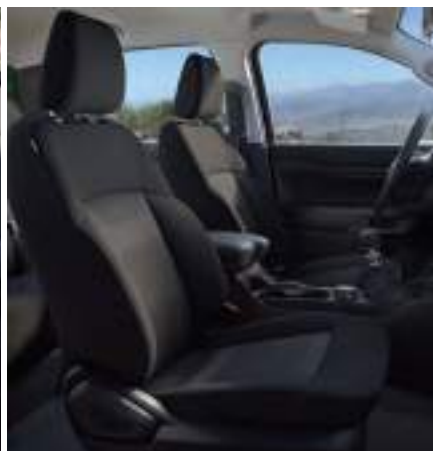
FORD RANGER W WERSJI XL (PODWÓJNA KABINA) Z LAKIEREM ZWYKŁYM FROZEN WHITE (BEZ DOPLATY)