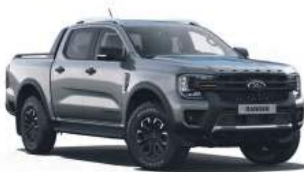
CARBONIZED GREY - LAKIER METALIZOWANY 3 200 zł