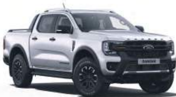
ICONIC SILVER - LAKIER SPECJALNY 3 200 zł