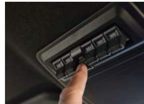
ZESTAW DODATKOWYCH PRZEŁĄCZNIKÓW ZAMONTOWANYCH POD SUFITEM

Standard dla wersji Platinum Dla pozostałych wersji opcja dostępna tylko w Pakietach marketingowych