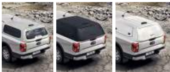
HARDTOP - sztywny dach skrzyni ładunkowej Do wyboru: w kolorze nadwozia (z oknami), w kolorze czarny mat. (bez okien) lub biały (bez okien). Tylko dla wersji podwójna kabina