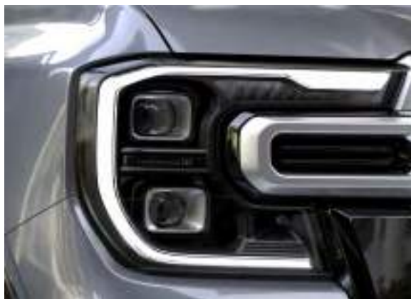
REFLEKTORY PRZEDNIE - ADAPTACYJNE FULL LED Standard dla wersji Platinum Dla wersji Wildtrak X opcja dostępna tylko w Pakiecie Wildtrak X